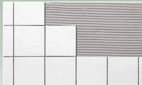
ใช้สำหรับภายในและภายนอก