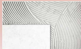
ใช้สำหรับภายในและภายนอก