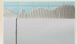
ใช้สำหรับภายในและภายนอก