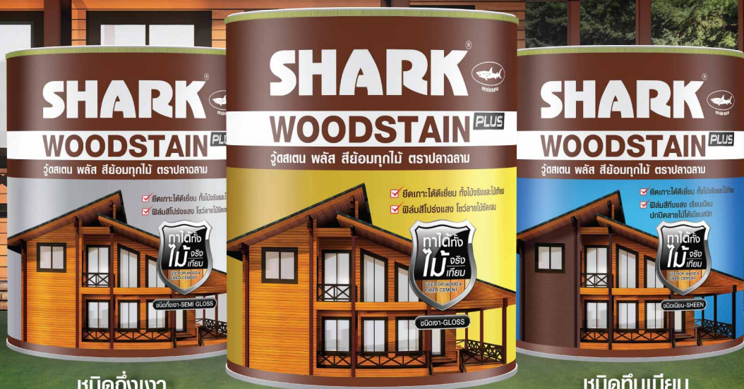
ชนิดกึ่งเงา